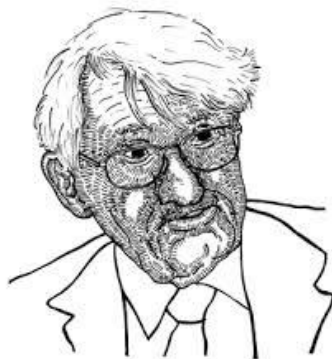
De intellectuele 'koning' van Starnberg: Jürgen Habermas

Ethiek is gezien vanuit de discoursethiek niet iets voor een dashboard met meters voor de snelheid of voorraadverbruik per deugd, waarde of principe. De discoursethiek wijst op het belang van alle betrokkenen in een proces van gezamenlijke besluitvorming. Dat vereist een actieve opstelling van deelnemers. In een gezondheidszorgcasus zal de hulpverlener een actieve verbale opstelling moeten tonen in de vorm van initiatief, stimulering, overtuiging, het overnemen van de beslissing. Een dialoog vanuit de discoursethiek eindigt niet vrijblijvend. Maar mochten de betrokkenen concluderen tot een opname in een zorgcentrum, dan zal er wel 'een plek vrij moeten zijn'.